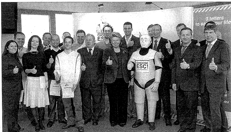
Viviane Reding au milieu des participants de la réunion d'hier au centre de formation de Colmar-Berg

Mais l'ESC n'est qu'un des éléments de l'initiative «Véhicule intelligent» par laquelle la Commission européenne entend promouvoir des véhicules plus intelligents, plus sûrs et plus propres.